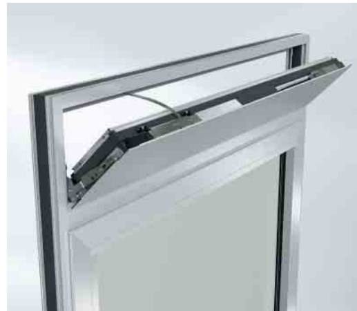
Die Lüftungsflügel AWS VV mit TipTronic Beschlag sind als Kipp-“Oberlicht“- und als Drehlösung verfügbar The AWS VV ventilation vents with TipTronic fittings are available as bottom-hung “toplight” and side-hung solutions

Schüco Lüftungsflügel AWS VV (Ventilation Vent) sind als opake Drehflügel in 300 mm, 250 mm und 170 mm Ansichtsbreite verfügbar. Mit dem umfangreichen Profilsortiment in den Systembautiefen von 65 bis 90 mm ist es Schüco gelungen eine hohe Flexibilität im Systemgeschäft anzubieten. Die bis Raumhöhe realisierbaren Drehflügel kombinieren schnelle Raumdurchlüftung mit hoher architektonischer Gestaltungsfreiheit. Im Sommer können die Drehflügel dauerhaft geöffnet bleiben. Die Flügel sind komfortabel zu bedienen und eignen sich ideal zur Kombination mit großen verglasten Elementen und Festverglasungen.