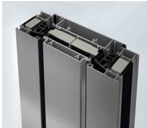
Horizontalschnitt durch den Lüftungsflügel Horizontal section detail through the ventilation vent