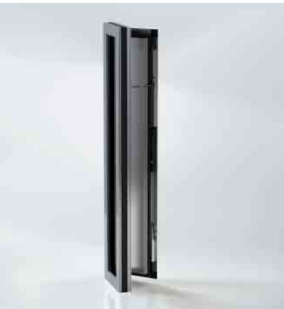
Es sind bis zu raumhohe Lüftungsflügel realisierbar Floor-to-ceiling ventilation vents are possible.